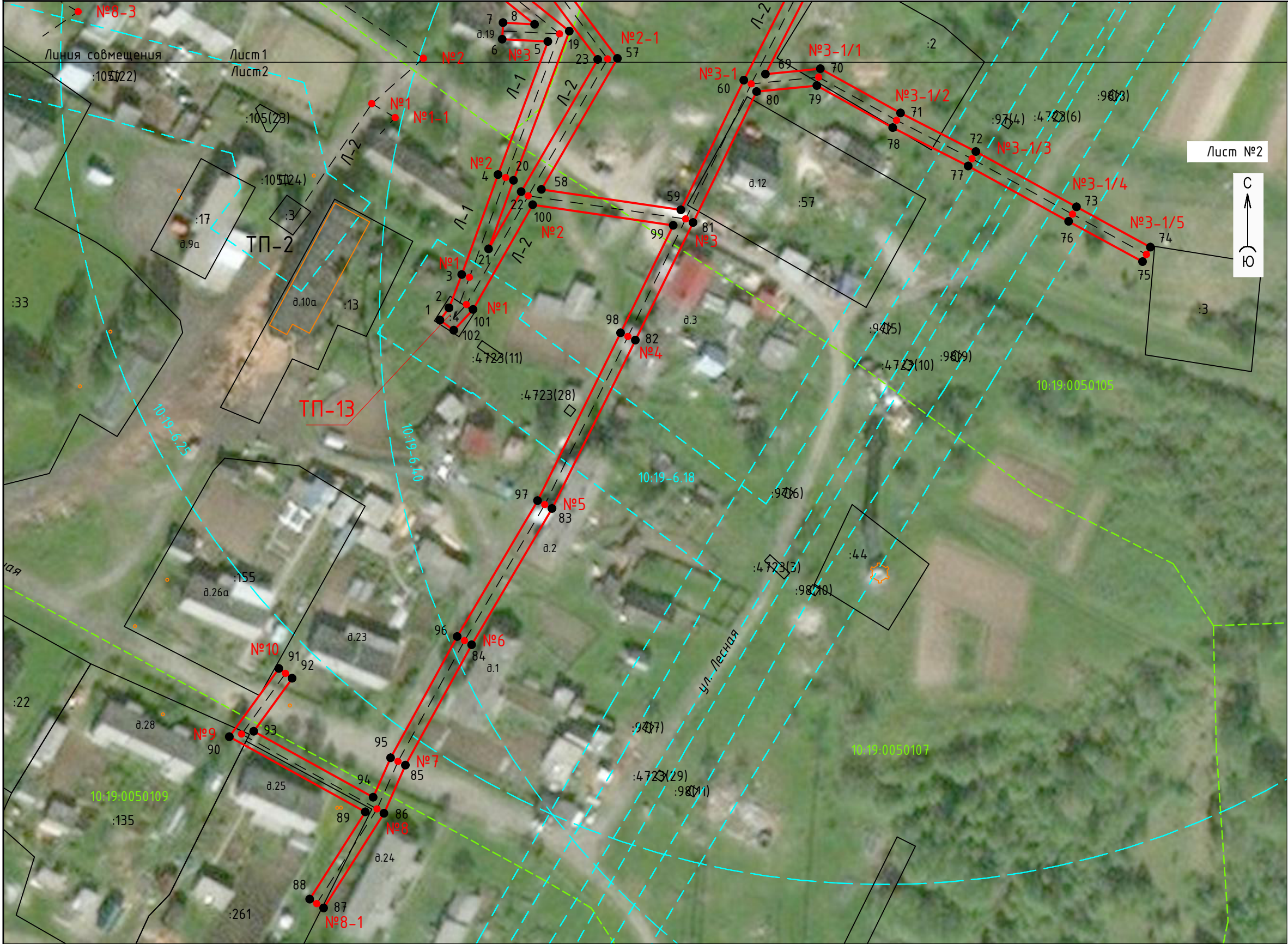
Схема расположения границ публичного сервитута для размещения (эксплуатации) объекта электросетевого хозяйства "ВЛ-0,4 кВ от ТП-13 Л-1, 2 с.Ругозеро"